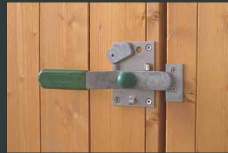
ALLEMANN - Zuhaltung, innen