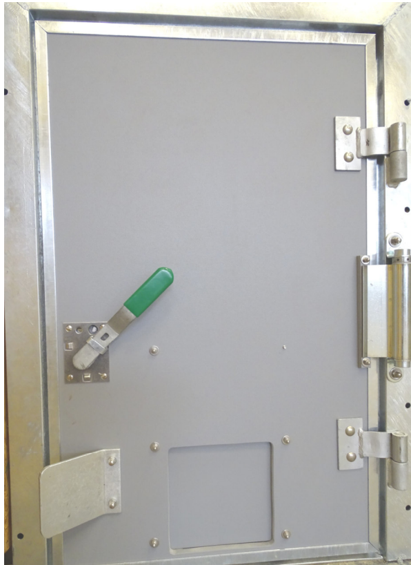
Auslafluke DIN R mit Federband und Rüsselöffner Spezialverschluss mit abnehmbarem Griff Hier: Zusätzlich mit Ferkelschlupf